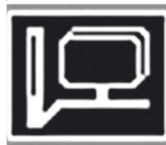
Оповещение о муляже радара Стрелка-СТ