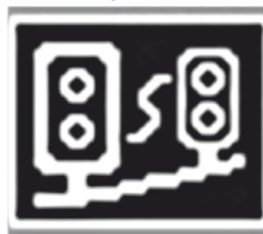
Оповещение о секционных камерах, типа «Автодория»: Старт/Финиш