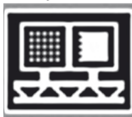
Оповещение о стационарном радаре Стрелка-СТ

Визуальные оповещения о всех видах объектов, содержащихся в базе координат выглядят следующим образом: