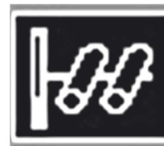
Оповещение о системе видеофиксации «ПОТОК»