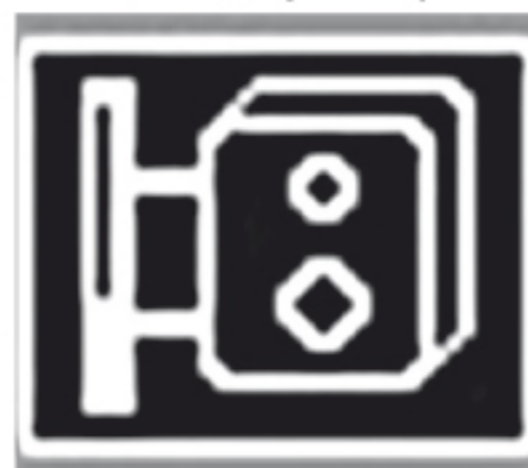
Оповещение о «малозумном» радаре