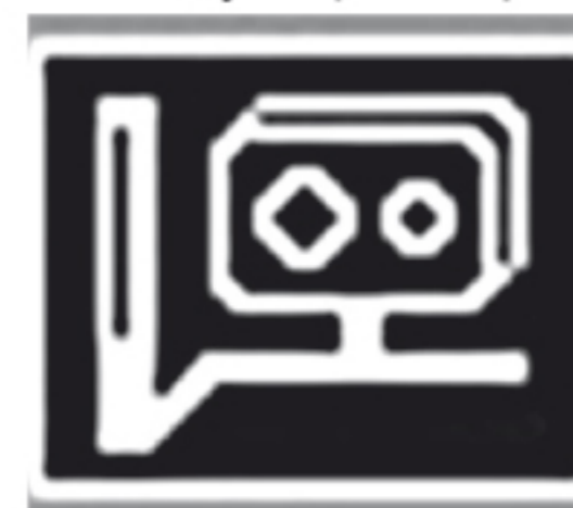
Оповещение о комплексе видеофиксации